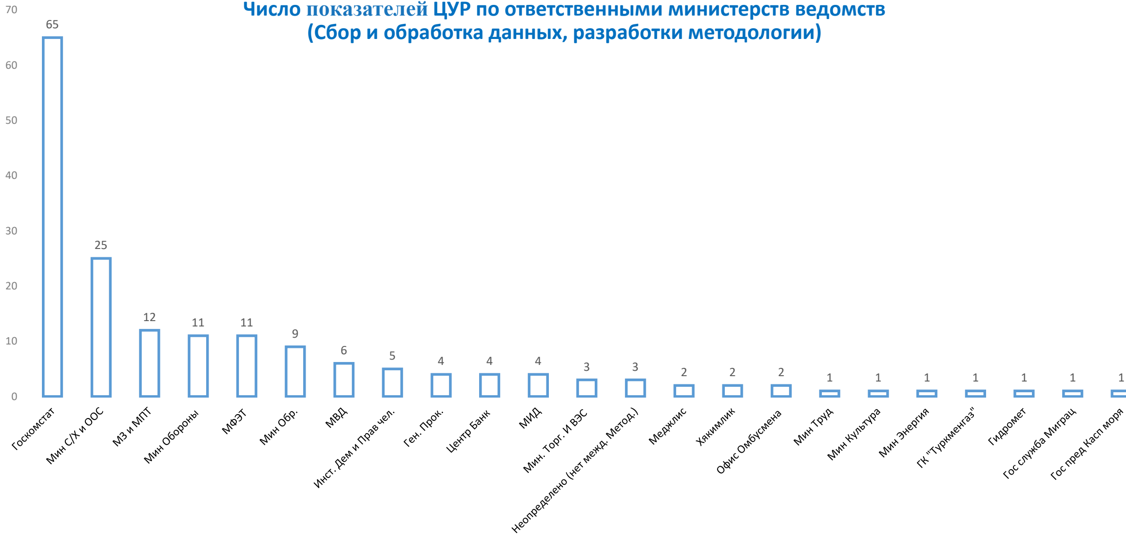
Число показателей ЦУР по ответственным министерствам ведомств (Сбор и обработка данных, разработки методологии)